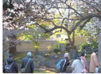
ちやうせんじ うめ み い 長仙寺に梅を見に行きました！