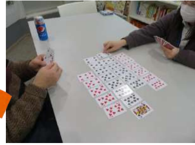
けいもくかい K木会ではトランプをしたり...