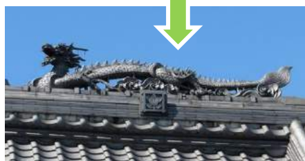
ちようぜんじほんどう やね 長善寺本堂の屋根