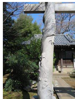
こうえんじけいだい いなりしや 高円寺境内の稲荷社