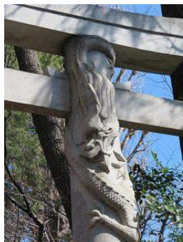
まばしいなりじんじや 馬橋稲荷神社